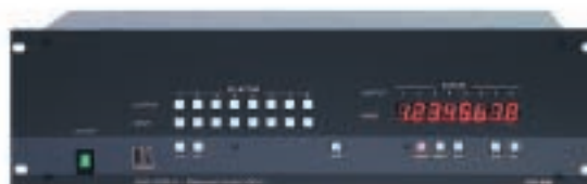
VP-88, 8x8 RGBHV router med balanserat ljud. Videobandbredd över 300 MHz.

Tura Scandinavia. Att: Joakim Elm Energigatan 15 B, 434 37 Kungsbacka Tel 0300-56 89 13 Fax 0300-56 89 29 E-post joakim.elm@tura.se www.tura.se